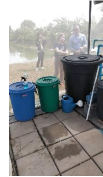
สถานีที่ 3 การเจริญเติบโตของเมล็ดอ่อน