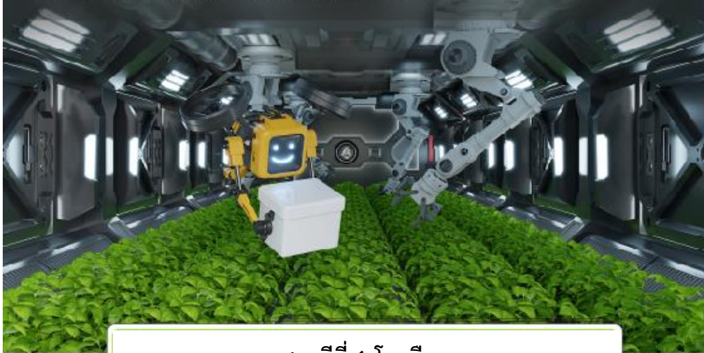
สถานีที่ 1 โรงเรือน

กระทรวงอุตสาหกรรม เป็นหน่วยงานหลักในการร่วมบูรณาการกับหน่วยงานต่างๆ ที่เกี่ยวข้องกับการขับเคลื่อนมาตรการพิเศษเพื่อขับเคลื่อน SMEs สู่ยุค 4.0 ส่งเสริมให้ผู้ประกอบการ มีศักยภาพและมีขีดความสามารถในการแข่งขันเพิ่มขึ้น กองพัฒนาเกษตรอุตสาหกรรม กรมส่งเสริมอุตสาหกรรม ได้เห็นความสำคัญในการส่งเสริมภาคการเกษตรอันเป็นรากฐานของระบบเศรษฐกิจของประเทศ จึง มอบหมายให้มหาวิทยาลัยเทคโนโลยีราชมงคลธัญบุรี ดำเนินกิจกรรมการเชื่อมโยงเครือข่าย ผู้ให้บริการเครื่องจักรกลทางการเกษตร เพื่อตอบสนองต่อแนวทางการพัฒนาภาคการเกษตรของรัฐบาล สร้างความเข้มแข็งที่ยั่งยืนให้แก่กลุ่มเครือข่ายเครื่องจักรกล โดยการเชื่อมโยงเครือข่าย ผู้ประกอบการ ผู้ให้บริการเครื่องจักรกลทางการเกษตร และเกษตรกรเข้าสู่ห่วงโซ่การผลิตเกษตรอุตสาหกรรมอย่างมีประสิทธิภาพ ยกระดับโครงสร้างทางเศรษฐกิจของประเทศอย่างยั่งยืน และเกิดผลในการปฏิบัติอย่างแท้จริง