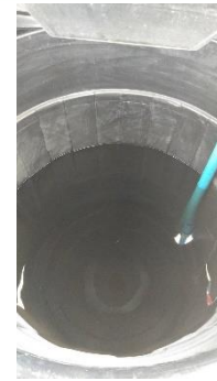
สถานีที่ 2 เครื่องปรับสภาพน้ำ