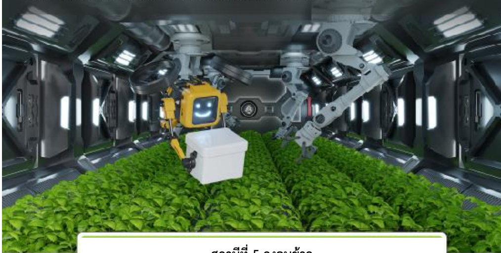
สถานีที่ 5 ถูบข้าว

กระทรวงอุตสาหกรรม เป็นหน่วยงานหลักในการร่วมบูรณาการกับหน่วยงานต่างๆ ที่เกี่ยวข้องกับการขับเคลื่อนมาตรการพิเศษเพื่อขับเคลื่อน SMEs สูยุค 4.0 ส่งเสริมให้ผู้ประกอบการ มีศักยภาพและมีขีดความสามารถในการแข่งขันเพิ่มขึ้น กองพัฒนาเกษตรอุตสาหกรรม กรมส่งเสริมอุตสาหกรรม ได้เห็นความสำคัญในการส่งเสริมภาคการเกษตรอันเป็นรากฐานของระบบเศรษฐกิจของประเทศ จึง มอบหมายให้มหาวิทยาลัยเทคโนโลยีราชมงคลธัญบุรี ดำเนินกิจกรรมการเชื่อมโยงเครือข่าย ผู้ให้บริการเครื่องจักรกลทางการเกษตร เพื่อตอบสนองต่อแนวทางการพัฒนาภาคการเกษตรของรัฐบาล สร้างความเข้มแข็งที่ยั่งยืนให้แก่กลุ่มเครือข่ายเครื่องจักรกล โดยการเชื่อมโยงเครือข่าย ผู้ประกอบการ ผู้ให้บริการเครื่องจักรกลการเกษตร และเกษตรกรเข้าสู่ห่วงโซาการผลิตเกษตรอุตสาหกรรมอย่างมีประสิทธิภาพ ยกระดับโครงสร้างเศรษฐกิจของประเทศอย่างยั่งยืน และเกิดผลในการปฏิบัติอย่างแท้จริง